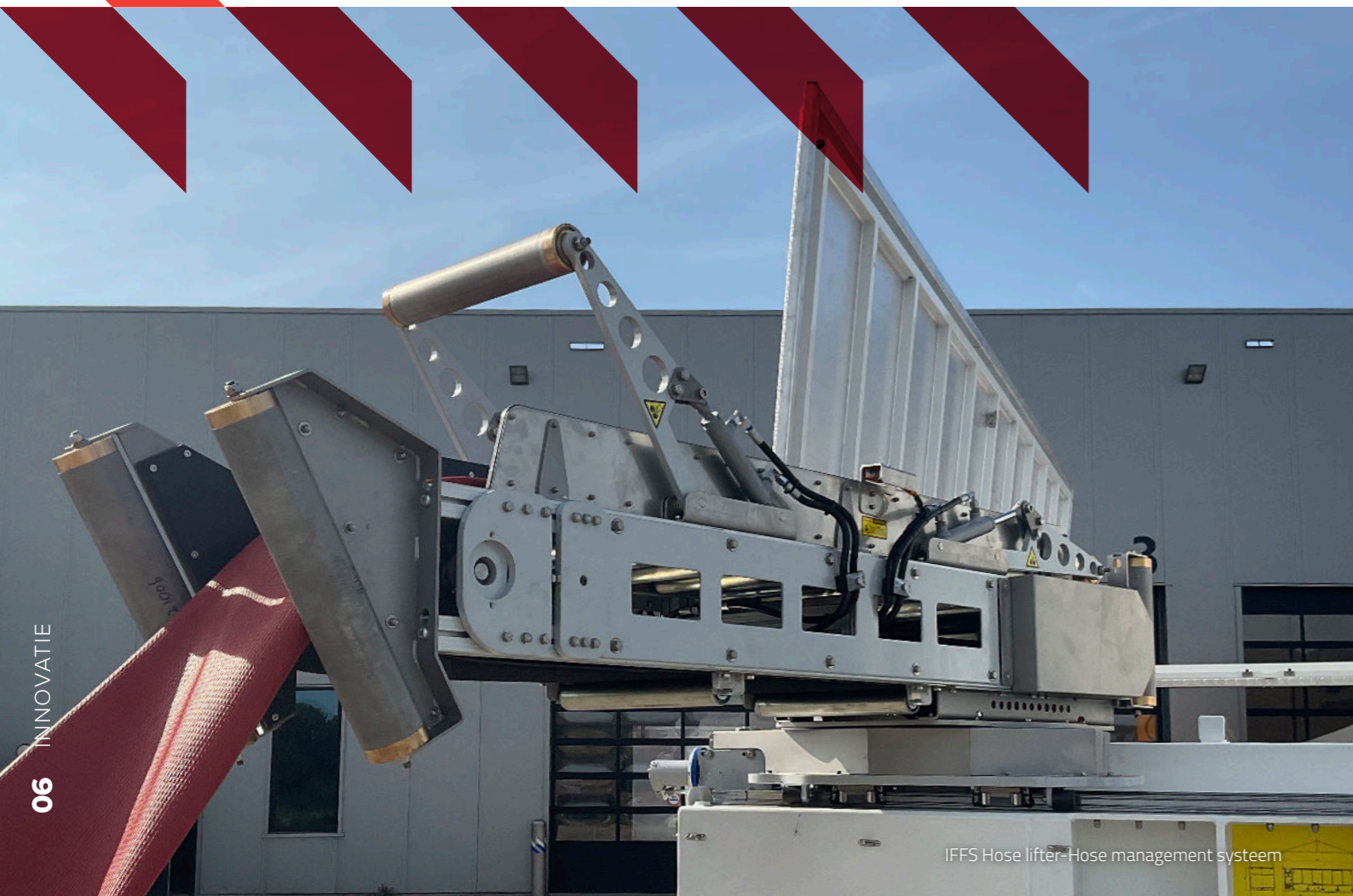
IFFS Hose lifter-Hose management systeem